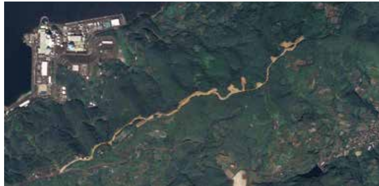
国土交通省空中写真 伊方 2008年