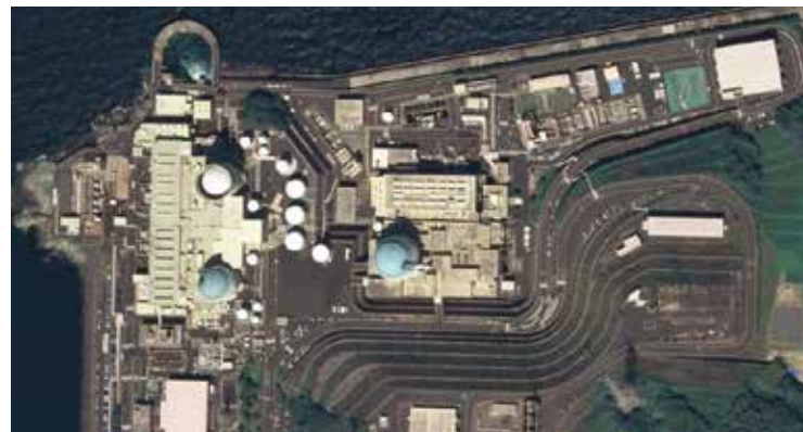
国土交通省空中写真 伊方 2008年