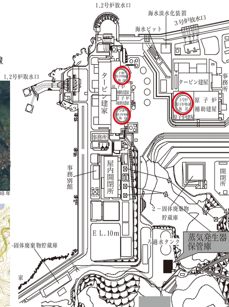
配置図 伊方発電所原子炉設置変更許可申請の概要について平成15年原子力規制委員会資料より