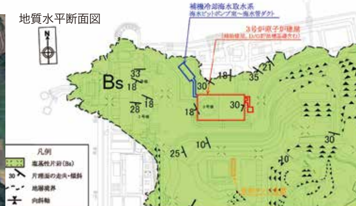
伊方発電所3号機耐震評価に係るコメント回答平成26年 原子力規制委員会資料