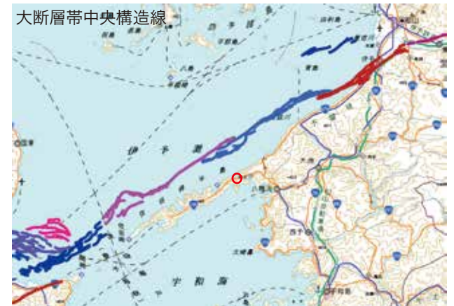
活断層地図:産総研活断層データベース(国土地理院地図利用)CCより